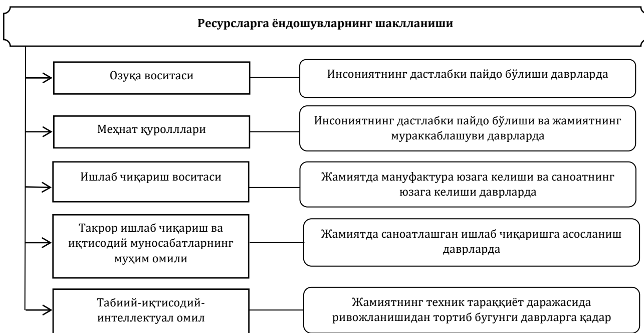
1-расм. Ресурсларга ёндошувларнинг шаклланиши

Ресурсларни солиққа тортиш масалаларни қамраб олганлиги сабабли илмий билиш нуқтаи назаридан ресурсларнинг шаклланиши, уларнинг туркумланиш асослари, уларнинг ички ва ташқи хусусиятлари, энг муҳим уларга иқтисодий ресурс сифатидаги ёндошувларни илмий-назарий жиҳатдан ўрганиш муҳим деб ҳисоблаймиз. Чунки, ресурсларни солиққа тортиш жараёнида уларнинг ички моҳиятини чуқур аниқлаш ҳолда ёндошилса, ресурсларни адолатли солиққа тортиш имконияти мавжуд бўлади.