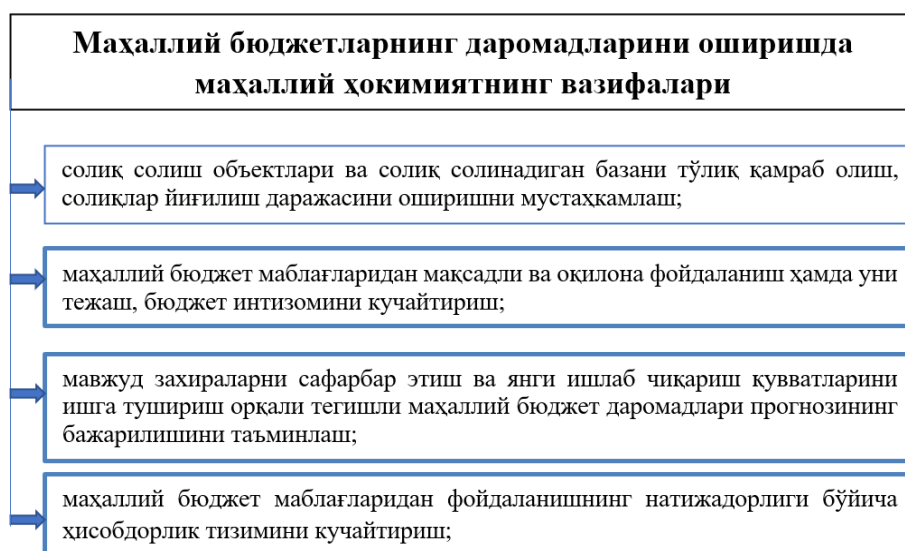
2-расм. Маҳаллий бюджетларнинг даромадларини оширишда маҳаллий ҳокимиятнинг вазифалари