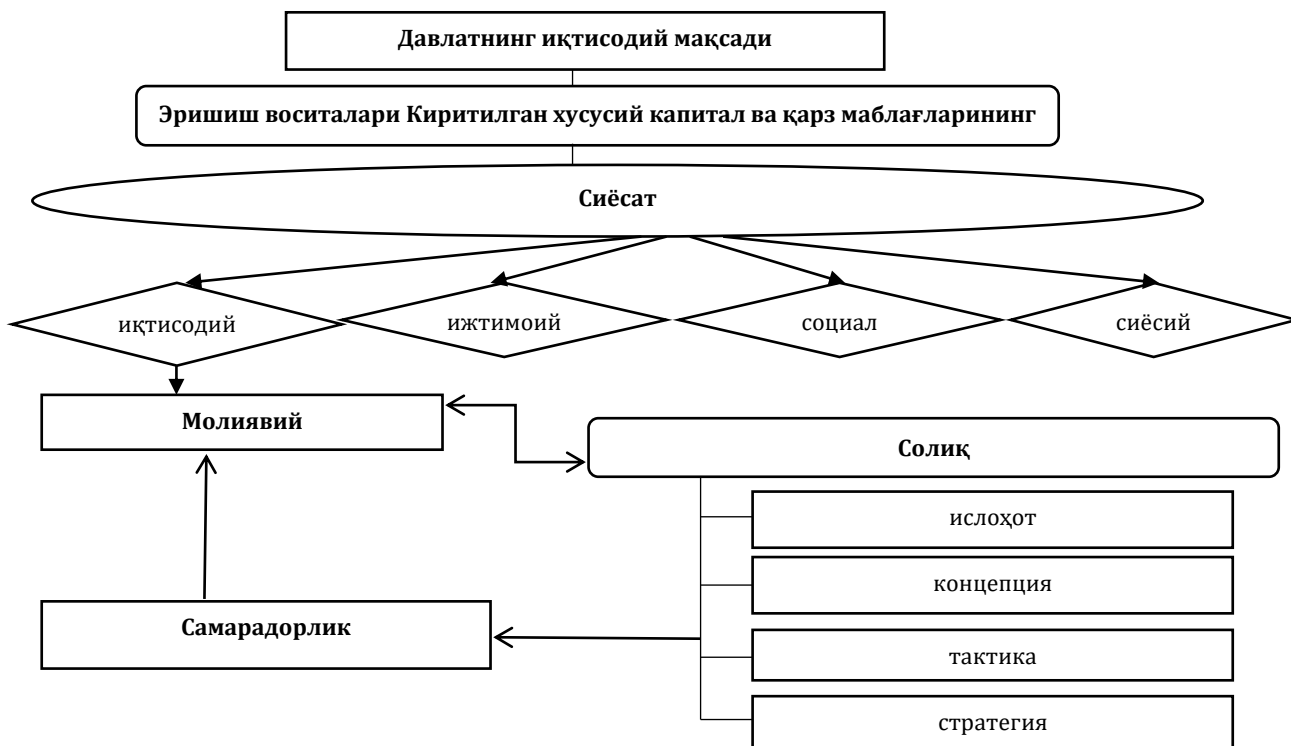
1-расм. Давлат иқтисодий мақсади ва солиқ сиёсати ўртасидаги узвийлик

рорлик ташкил этади, унинг фаолиятини таъминлашда эса молиявий ҳамда унинг таркибий қисми бўлган солиқ сиёсати муҳим эҳтиёж бўлиб объектив равишда юзага чиқади.