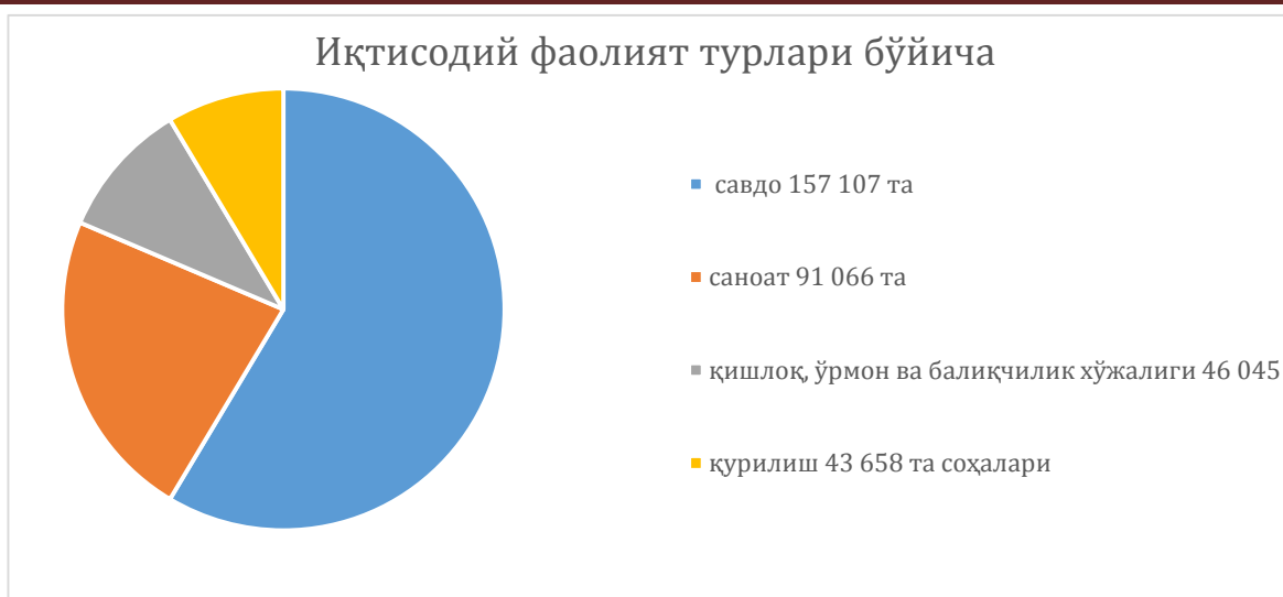
2-расм. Ўзбекистонда тадбиркорлик субъектлари сони