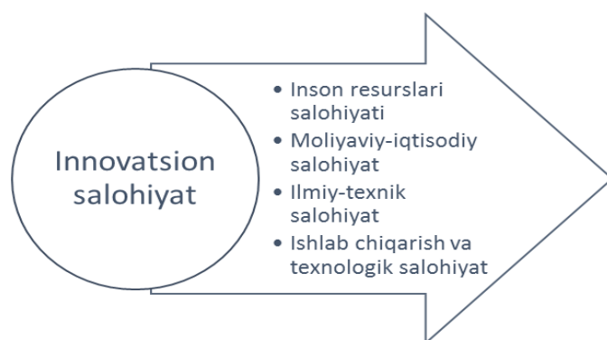
1-rasm. Korxonaning resurslar salohiyati

kadrlar, ishlab chiqarish va texnologik, ilmiy-texnik, moliyaviy-iqtisodiy, innovatsion va boshqa salohiyat turlariga ajratiladi. Resurs salohiyatining qiymati nafaqat tarkibiy resurslarning miqdoriy xususiyatlari, balki ularning bog'lanish tabiati bilan ham belgilanadi. Resurs komponentlarini ulash usuli korxonaning resurs salohiyatini ham shakllantiradi. Ularning o'zaro ta'siri natijasida yangi sifat belgilari paydo bo'ladi. 1-rasmda korxonaning asosiy tarkibiy qismlari bilan o'zaro ta'sirida umumiy resurs salohiyati ko'rsatilgan, bu yangi parametrlarning paydo bo'lishi bilan tavsiflanadi, xususan, innovatsion salohiyat bilan xarakterlidir. Ikkinchisi butun salohiyatning yadrosini tashkil etuvchi o'z innovatsion faoliyat uchun, korxonaga uchun mavjud imkoniyatlarni ifodalaydi.