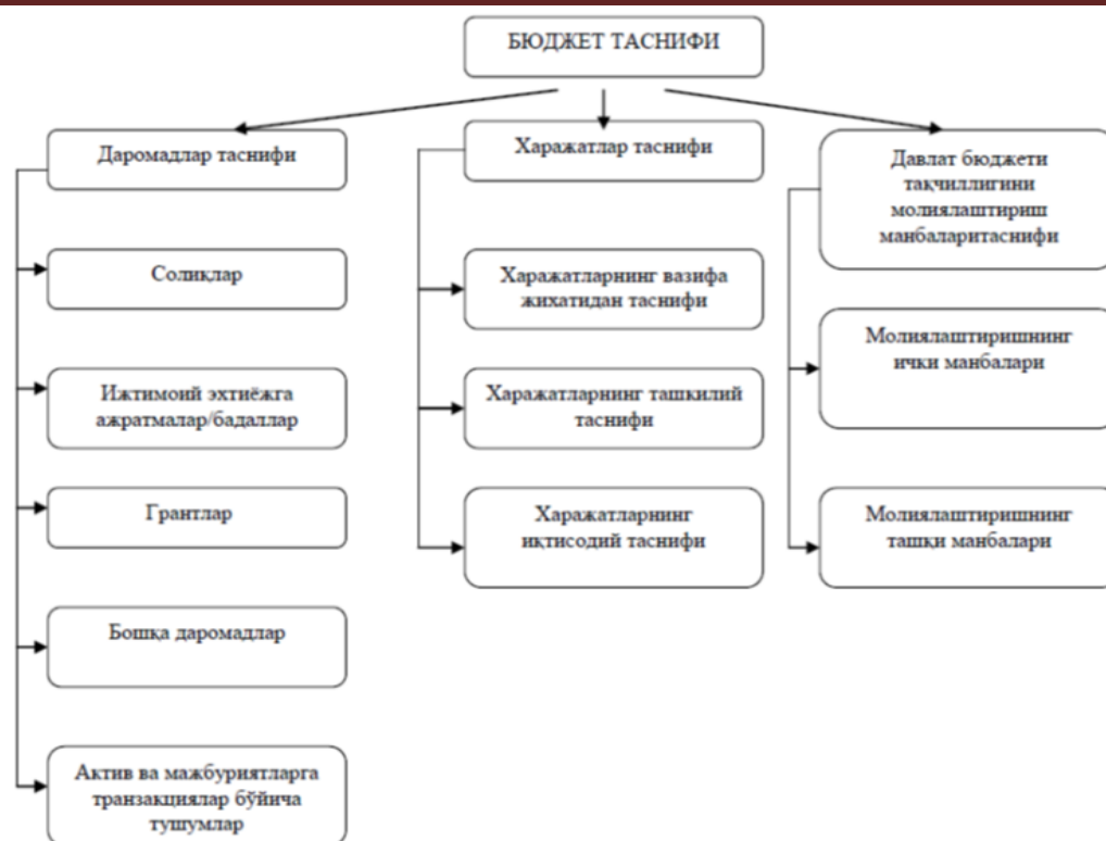
1-расм. Бюджет таснифининг таркиби