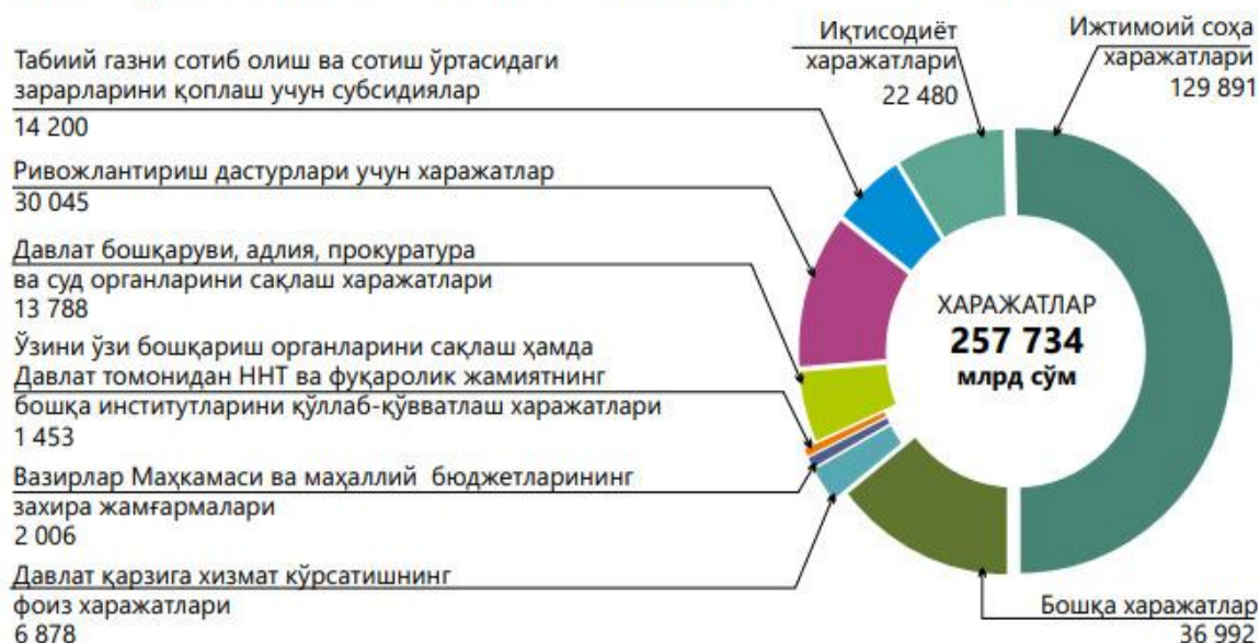
2-расм. 2023 йил давлат бюджети харажатлари таркиби [15]

Ижтимоий харажатларга 129 891 млрд сўм йўналтирилиши белгиланган, бу ўз навбатида жами Давлат бюджети харажатларининг 50,4 фоиизини ташкил этади (3-расм).