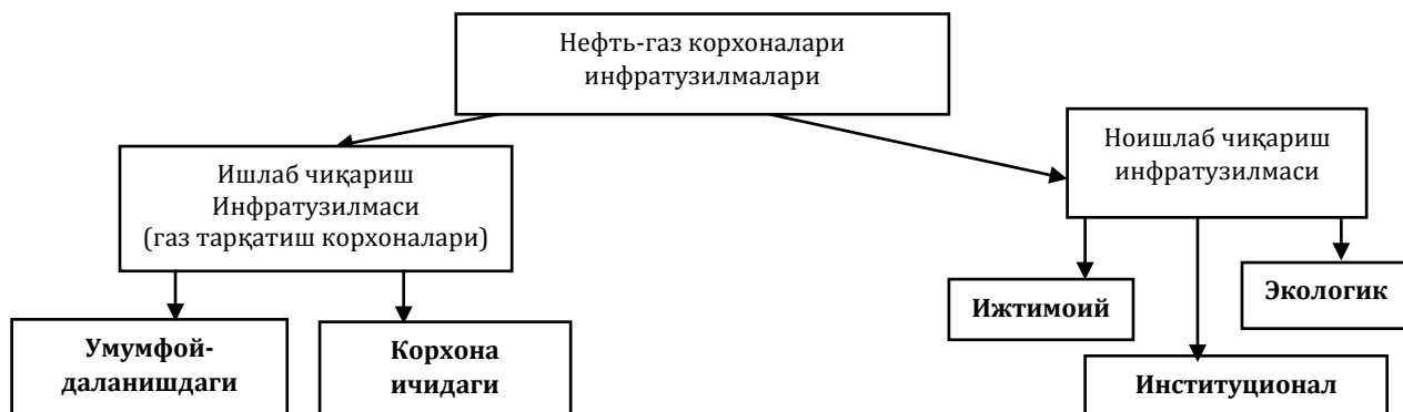
3-расм. Нефть-газ корхоналарида ишлаб чиқариш ва ноишлаб чиқариш инфратузилма турлари

Ишлаб чиқариш инфратузилмаси таркибидаги транспорт инфратузилмасининг нисбатан янги элементи қувур транспорти ҳисобланади. БМТ статистикасига биноан 27 та мамлакатда мавжуд бўлган магистраль нефть қувурларининг узунлиги 436 минг км ни ташкил этади. Энг йирик нефть қувурлари АҚШ ва Россияда жойлашган. Инфратузилмаларни ишлаб чиқариш ва ноишлаб чиқариш турларини қуйида келтирилган расмда акс эттирганмиз (3-расм).