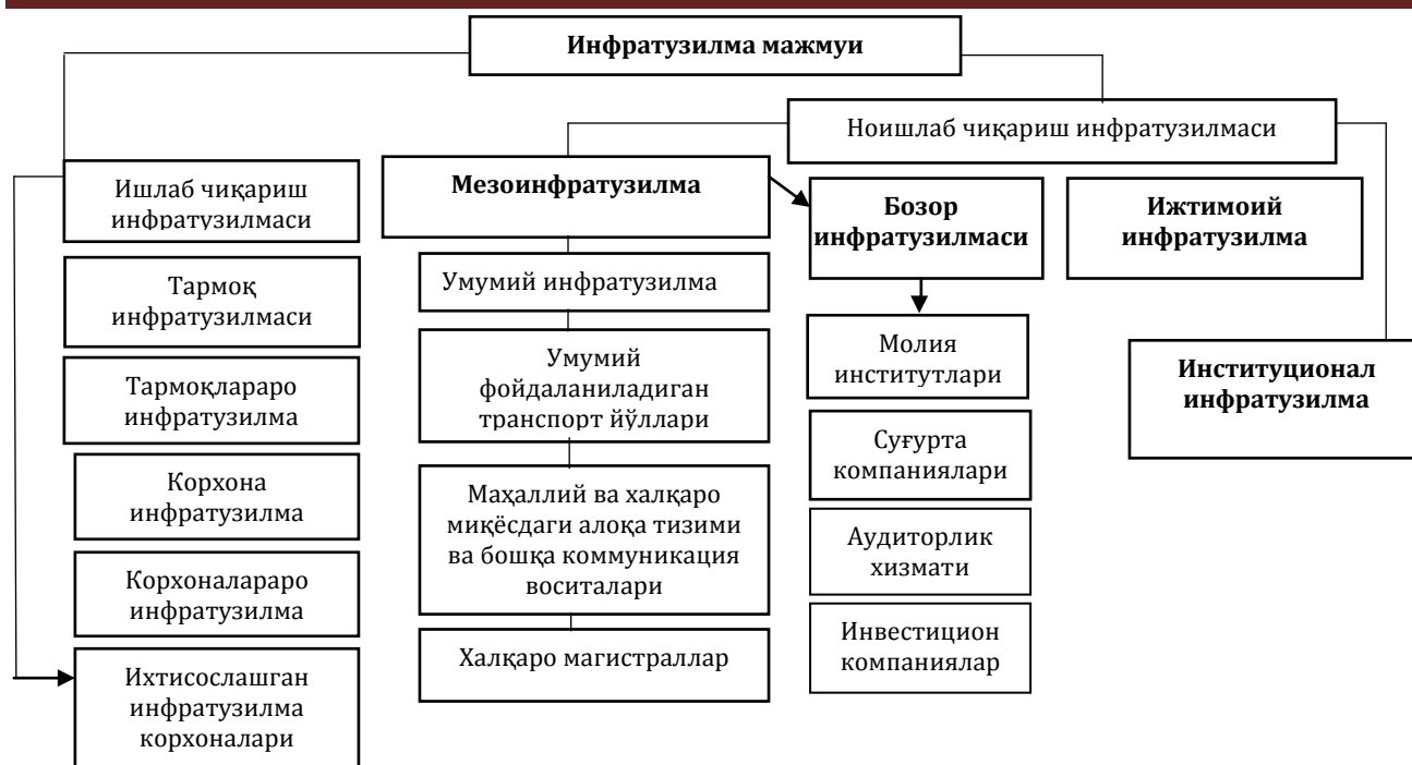
1-расм. Инфратузилма мажмуи