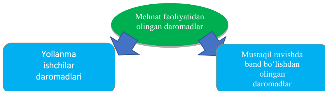
2-rasm. Mehnat faoliyatidan olingan daromadlar