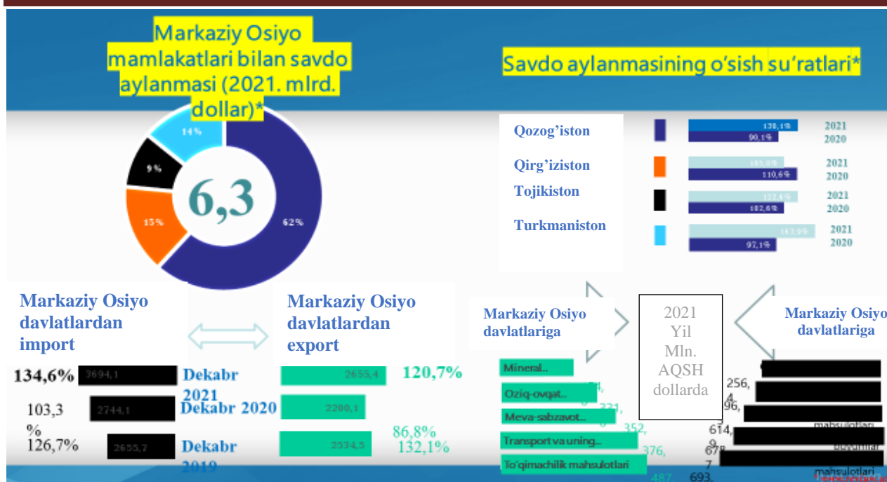
2-rasm. O'zbekistonning 2021-yildagi Markaziy Osiyo davlatlari bilan savdo aylanmasining o'sish sur'atlari[15]

Eksport salohiyatini oshirish orqali mamlakat ichida ixtisoslashtirilgan ishlab chiqarishning rivojlanishiga erishiladi. Mamlakat eksporti hamda importning qiymati o'rtasidagi farq, ya'ni saldo tashqi iqtisodiy faoliyat samaradorligining muhim iqtisodiy ko'rsatkichi bo'lib hisoblanadi. Ushbu ko'rsatkich milliy daromad darajasiga ko'p tomonlama ta'sir etadi. Sababi, import va eksport hajmidagi sezilarli o'zgarish ham mamlakatdagi daromad, bandlik va narx darajalarida muayyan tebranishlarni keltirib chiqarishi mumkin. Keyingi yillarda mamlakatimizda keskin raqobatlashuv sharoitida ishlab chiqarilayotgan mahsulotlarning jahon va mintaqaviy bozorlarda xaridorgir bo'lishi va mustahkam o'rin egallashi uchun bir qator chora-tadbirlar amalga oshirilmoqda, jumladan, mamlakatning iqtisodiy tarmoqlarida investitsiya muhitni shakllantirish va uning jozibadorligini ta'minlash borasida maxsus iqtisodiy zonalarini tashkil etish va mazkur zonalariga to'g'ridan to'g'ri xorijiy investitsiyalarni jalb qilish alohida ahamiyatga ega. Mamlakatimizda tashqi iqtisodiy faoliyat bo'yicha 2022-yilda 2021-yilga nisbatan sezilarli darajada o'zgarishlar kuzatilgan.