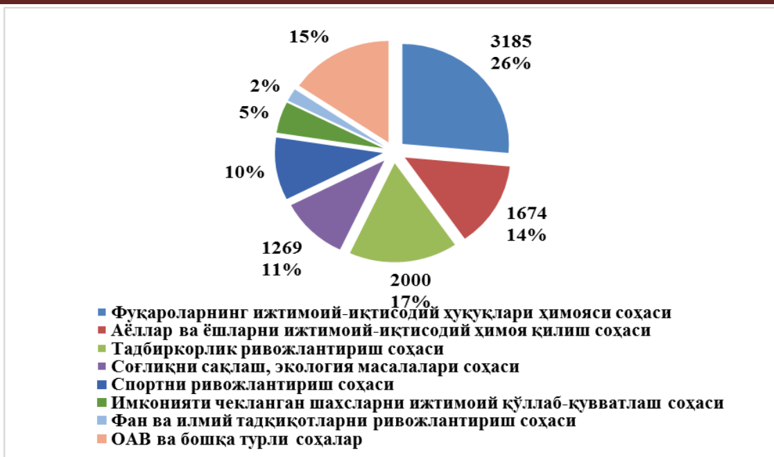
1-расм. Ўзбекистонда ННТ ташкил этилган соҳалар сони[21]

Адабиётлар шарҳи. Бугунги кунга қадар йирик тижорат компаниялари ва акциядорлик жамиятларида аудиторлик текширувларини ташкил этиш масалаларига норматив-ҳуқуқий ҳужжатлар ва бир қатор иқтисодчи олимларнинг илмий асарларида кенг эътибор қаратилган.